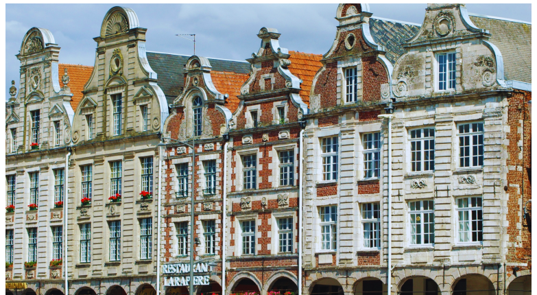
Grand Place d'Arras (côté ouest)

Cette immense place de 184 m de long est bordée par 155 bâtiments de style baroque flamand avec leurs façades à pignons à volutes.