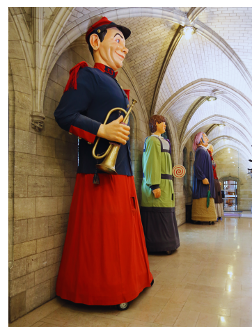
Géants d'Arras, Hôtel de ville

Si cette salle de fêtes n'est malheureusement pas accessible au public, ce n'est pas le cas des Géants d'Arras . Ceux-ci représentent une famille de maraîchers originaire d'Achicourt et se trouvent dans le hall d'entrée, juste à côté de l'office du tourisme. Ils sortent une fois par an lors de la Fête des joueurs du 14 juillet. À l'origine, ils n'étaient que deux : Colas et Jacqueline , un couple. Ils ont été rejoints par leur fils, Dédé et puis par l'Ami Bidasse, en 2015