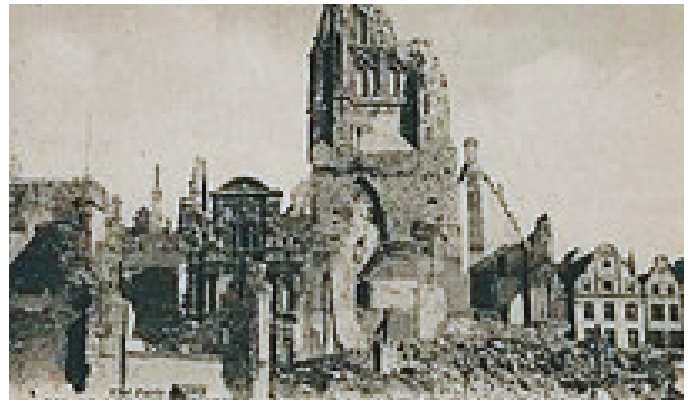
Hôtel de ville & Belfroy aujourd'hui (à gauche) - Ruines après les bombardements de la 1GM (à droite)

L'Hôtel de ville et le Belfroy dominent la place. En 1914, 69 tirs d'obus s'abattent sur l'Hôtel de ville et sur le Belfroy. L'ensemble est reconstruit à l'identique entre 1922 et 1932 dans un style gothique par l'architecte Pierre Paquet (architecte en chef des monuments historiques). Devenu le symbole de la ville, le Belfroy de 75 m de haut est non seulement la fierté des arrageois mais aussi une fierté nationale. En 2015, il est élu " monument préféré des français ".