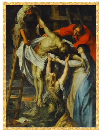
Rubens, Descente de croix, 1577 - 1640), Eglise St Jean-B. (Arras)

Jolie en extérieur, intéressante et riche à l'intérieur. L'église Saint Jean-Baptiste date du XIIe siècle. Plusieurs fois détruite et reconstruite, elle a récupéré un magnifique retable d'une ancienne chapelle de la place ainsi que la Descente de Croix de Rubens qui se trouvait autrefois dans la Cathédrale et qui a été déplacée après la Première Guerre mondiale.