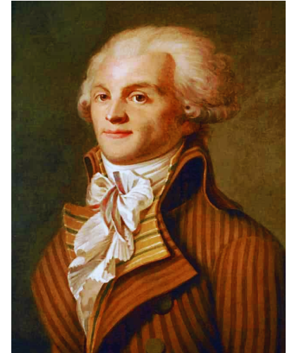
Maximilien de Robespierre (1758 - 1794), peinture vers 1790

La place du Théâtre n'a pas toujours été lieu de culture et d'amusement. Elle a été aussi le théâtre - c'est le cas de le dire - d' exécutions publiques aux heures sombres de la Terreur . Au centre se dressait la guillotine, juste en face de la rue Maximilien de Robespierre. Au n°9 de cette rue se trouve d'ailleurs, la Maison Robespierre où a grandi ce célèbre chef révolutionnaire. D'avocat à homme politique, Robespierre a su s'imposer comme leader de la Terreur pour mettre en place un régime politique républicain.