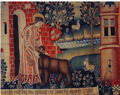
Saint-Vaast et l'ours, tapisserie du XVe, Musée des Beaux-Arts d'Arras

Saint Vaast fut l' Evêque d'Arras et le catéchiste de Clovis. La légende raconte que dans une église en ruine, il tomba nez à nez avec un ours qui terrorisait les fidèles. Saint Vaast ordonna alors à l'ours (le diable) de quitter les lieux. L'animal sans tarder s'exécuta. En souvenir de ce miracle , les moines auraient longtemps gardé un ours apprivoisé chez eux.