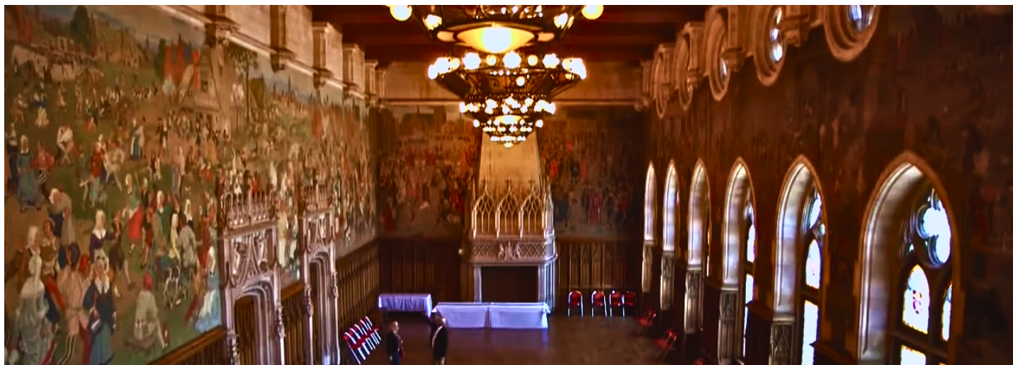
Hôtel de ville, salle des fêtes ( fresque d'Hoffbauer ), vue générale

L'Hôtel de ville possède une jolie façade aux arches inégales et donne accès au Beffroi. L'ascenseur soulage une grande partie de la montée mais il reste encore une quarantaine de marches à gravir pour pouvoir contempler un superbe panorama sur la ville.