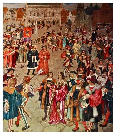
Hôtel de ville, salle des fêtes ( fresque d'Hoffbauer ), détails

Si cette salle de fêtes n'est malheureusement pas accessible au public, ce n'est pas le cas des Géants d'Arras . Ceux-ci représentent une famille de maraîchers originaire d'Achicourt et se trouvent dans le hall d'entrée, juste à côté de l'office du tourisme. Ils sortent une fois par an lors de la Fête des joueurs du 14 juillet. À l'origine, ils n'étaient que deux : Colas et Jacqueline , un couple. Ils ont été rejoints par leur fils, Dédé et puis par l'Ami Bidasse, en 2015