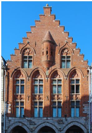
Hôtel des Trois Luppars (Grand Place)

Le bâtiment le plus ancien de la place date du XVe siècle et se trouve au n°49 où est installé l' Hôtel des Trois Luppars . Il est facilement reconnaissable grâce à sa petite colonne engagée au centre de la façade et grâce à son immense pignon en escalier "à pas de moineaux", c'est à dire, en gradins.